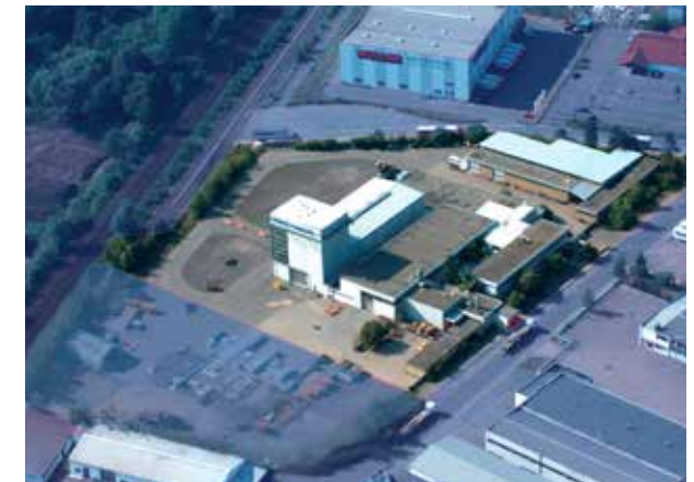
Dillingen, Industrie / Gewerbegebiet