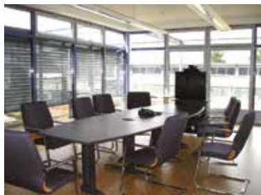
Konferenzraum 2. OG