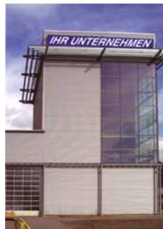
Halle 1 Turm

Halle 2: Eingeschossiger, ebenerdiger Hallenbau mit angegliederten Nebenräumen, Lichte Hallenhöhe: 8,00 m, unter der Kranbahn: 7,00 m 2 x Kranbahn: Einträgerlaufkran (Traglast: 1 x 8 to), Zweiträgerlaufkran mit obenliegender Katze (Traglast: 1 x 10 to)