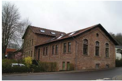
Bürogebäude hochwertig möbliert